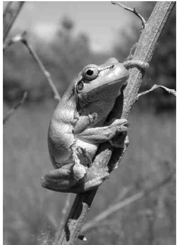
Rainette verte

Outre la FRAPNA et AVENIR avec qui nous entretenons des relations privilégiées, on pourra citer GENTIANA qui est l'équivalent flore du CORA, mais aussi les associations généralistes qui se sont développées localement : Lo Parvi avec qui nous avons une convention d'échange de données par exemple, le Pic Vert qui travaille en Pays Voironnais nous a côtoyé pour la défense des mares de l'Eterpa (La Buisse), mais aussi Drac Nature, le CEVC (Voiron, batraciens), Nature et Vie Sociale (Villefontaine, batraciens).