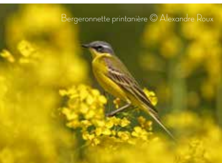
Bergeronnette printanière