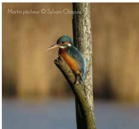
Martin pêcheur

Ce niveau aborde également les incidences humaines (pollution, destruction des habitats, chasse) et la mue des oiseaux.