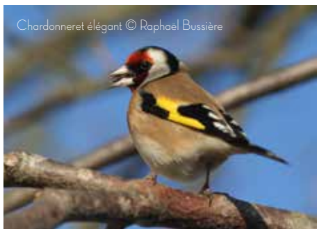
Chardonneret élégant

Le niveau 1 se présente sous forme de cours par thèmes : les espèces, les familles, le vol, la vie sexuelle ou encore la migration. L'accent est mis sur le plumage le plus reconnaissable (nuptial et/ou adulte) ou le plus fréquemment rencontré dans notre région.