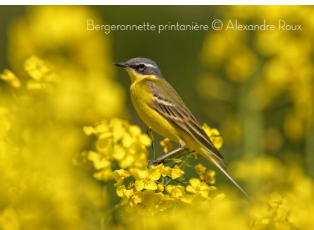
Bergeronnette printanière © Alexandre Roux