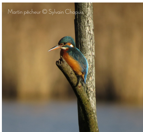
Martin pêcheur

Ce niveau aborde également les incidences humaines (pollution, destruction des habitats, chasse) et la mue des oiseaux.