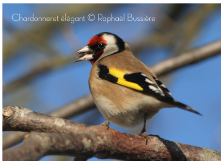
Chardonneret élégant

Le niveau 1 se présente sous forme de cours par thèmes : les espèces, les familles, le vol, la vie sexuelle ou encore la migration. L'accent est mis sur le plumage le plus reconnaissable (nuptial et/ou adulte) ou le plus fréquemment rencontré dans notre région.