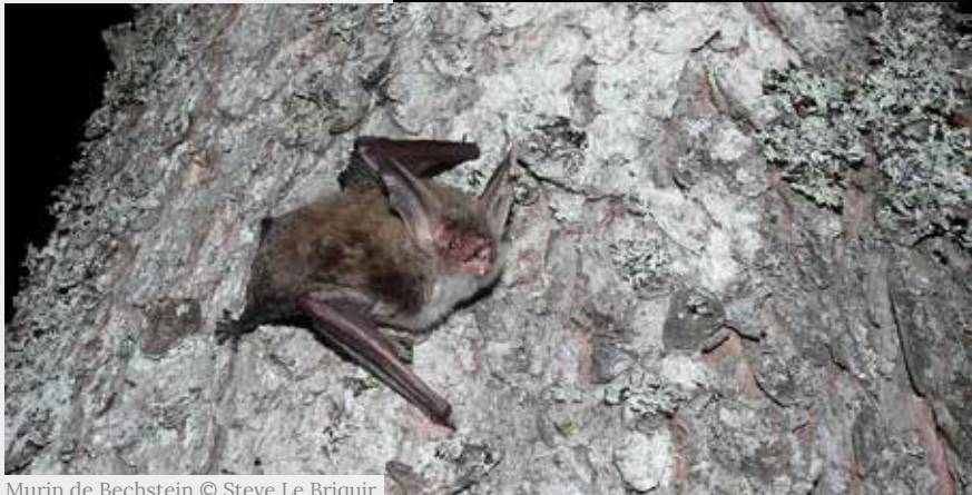
Murin de Bechstein