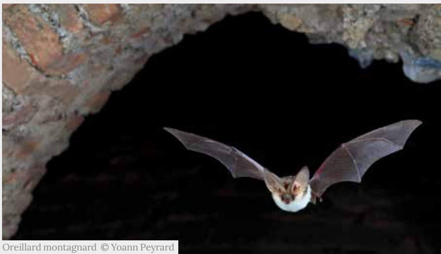
Oreillard montagnard

Trente-cinq espèces de chauves-souris sont présentes en France. Même si un grand nombre d'entre elles vit dans les grottes, certaines préfèrent les milieux forestiers.