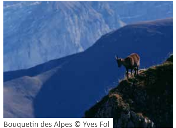
Bouquetin des Alpes