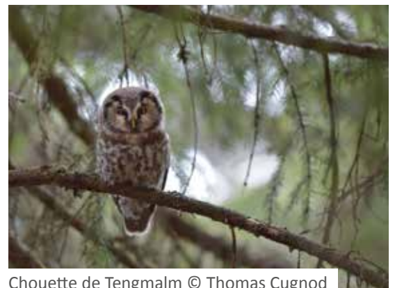
Chouette de Tengmalm