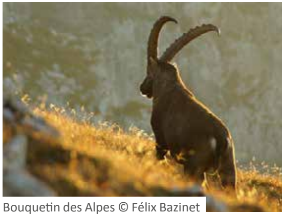
Bouquetin des Alpes