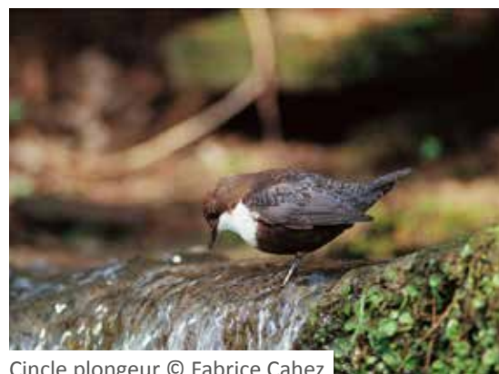
Cincle plongeur

De 9 h 30 à 13 h 30 Pont du Boeuf, Rives Blandine Doligez