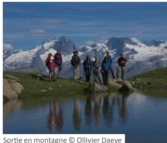
Sortie en montagne