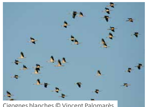
Cigognes blanches

Matin Monestier-de-Clermont Philippe Menanteau