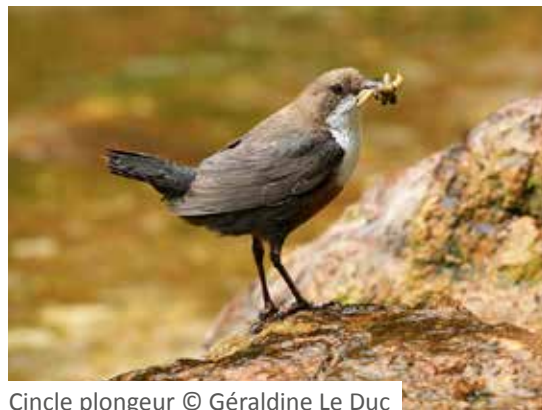
Cincle plongeur