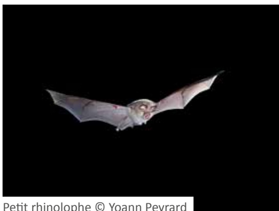
Petit rhinolophe