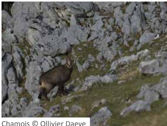
Chamois © Ollivier Daeye