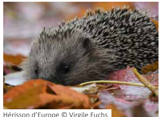
Hérisson d'Europe

De 16 h 00 à 17 h 30 Pont-de-Chérury Stéphane Gubian