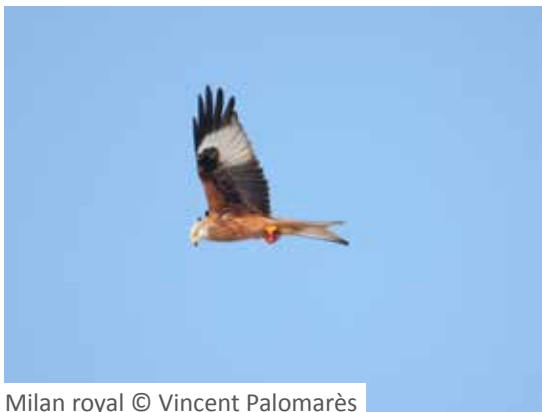
Milan royal